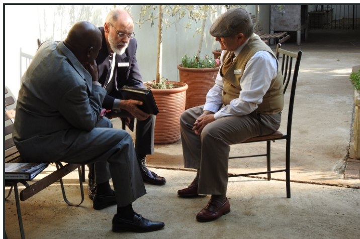
In-diepte besprekings van leierskap vind plaas tydens die Internasionale Leierskap Kliniek

Luk 1:17 is ook 'n belangrike bousteen in EKD Genesis. God het dit aan baie mense deur die jare onafhanklik bevestig. Daarom gee ons ons samewerking aan hierdie woord en beywer ons onself om deel te wees van 'n Elia span. (Mat 17:11.)