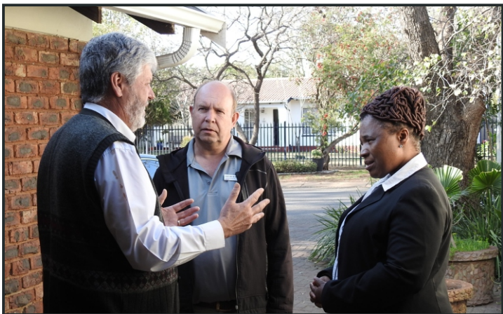
Groepbespreking tydens die Internasionale Leierskap Kliniek

1 Pet 2:5 leer ons dat ons die lewende boustene in die nuwe tempel van God moet wees. “... en laat julle ook soos lewende stene opbou, tot 'n geestelike huis, 'n heilige priesterdom, om geestelike offers te bring wat aan God welgevallig is deur Jesus Christus.”