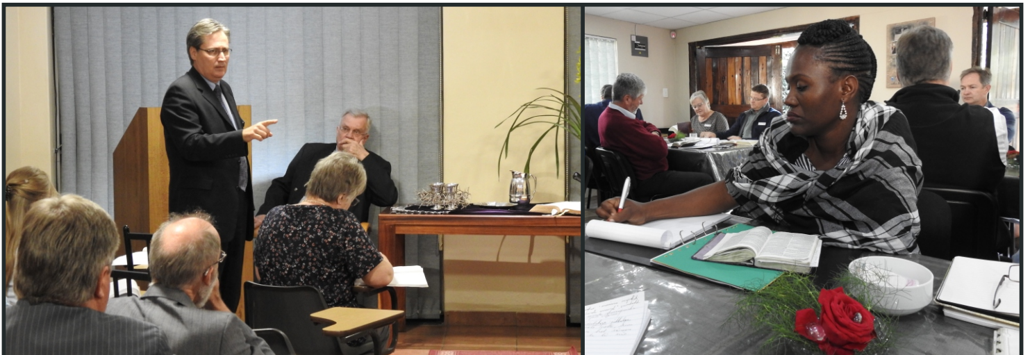
Om die huis van die Here te bou vra 'n "toegeruste volk" volgens Luk.1:17 - Leierskap klinieke word by EKD Genesis aangebied waar lering en geestelike toerusting die fokus is.

Die glorie van die huis van God lê nie in goud of silwer of edel gesteentes nie. (Dit waaruit die tempel van Salomo bestaan het.) Maar wel in die Gees van God wat in ons woonagtig is. Ten spyte hiervan sê die Woord dat die toekomstige heerlijkheid van hierdie nuwe huis sal groter wees as die vroeëre. Hag 1:8 sê "klim op die berg en bring hout aan en bou die huis." Daar word nie baie van my gevra nie. Dit laat my terugdink aan Abraham wat Isak op die berg moes gaan offer. Isak wou weet waar is die lam dan? Is ek bereid om die lam te wees en myself op die altaar te plaas?